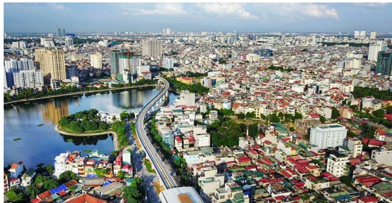
Thị trường bất động sản không tránh khỏi những “tổn thương” từ dịch Covid-19. (Ảnh minh họa)

Giá đất ở một số khu vực có hiện tượng “sốt” như: Hòa Lạc, Sơn Tây, Hoài Đức... đã có dấu hiệu sụt giảm, thể hiện qua thông tin chào bán trên thị trường nhưng cũng không xuất hiện giao dịch thực.