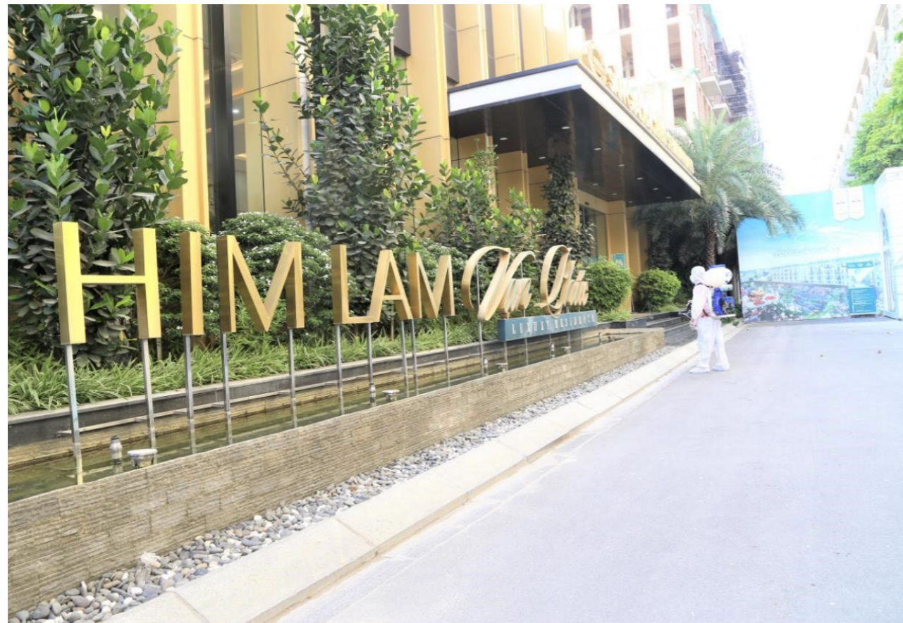
Công tác phun khử khuẩn tại sàn giao dịch Him Lam Vạn Phúc.

toàn, Công ty Cổ phần Kinh doanh Địa ốc Him Lam (Him Lam Land) đã tăng cường các biện pháp phòng chống dịch theo Chỉ thị của Thủ tướng Chính phủ và khuyến cáo 5K của Bộ Y tế.