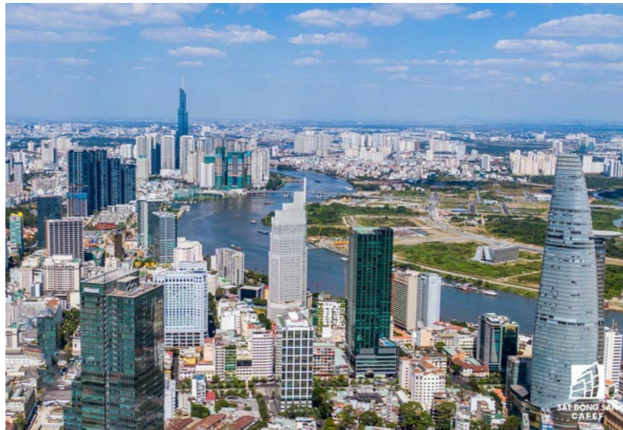
BDS công nghiệp, nghỉ dưỡng hồi phục mạnh, phân khúc nhà ở là “điểm sáng”. Ảnh minh họa

Còn đối với bất động sản công nghiệp, hiện nay đang có hiện tượng các công ty FPI rời khỏi Việt Nam, trong đó có khoảng 20% là các Hiệp hội, các phòng thương mại như Amcham, Kocham. Điều này sẽ tác động ít nhiều dòng vốn đổ phân khúc này. Ngoài ra, phải kể đến vấn đề các khu công nghiệp kéo người lao động trở về làm việc sau thời gian giãn cách.