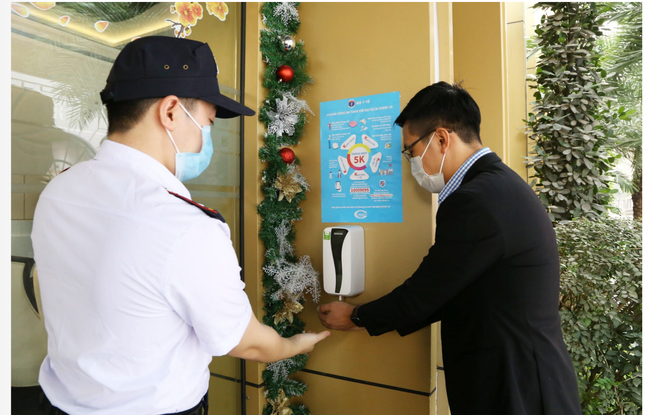
Vệ sinh khử khuẩn tại sàn được thực hiện liên tục để đảm bảo an toàn cho khách hàng.

Lam Land sẽ hạn chế số lượng CBCNV làm việc tại sàn giao dịch và cũng như số lượng khách hàng đến giao dịch theo đúng Chỉ thị 15 của Chính phủ.